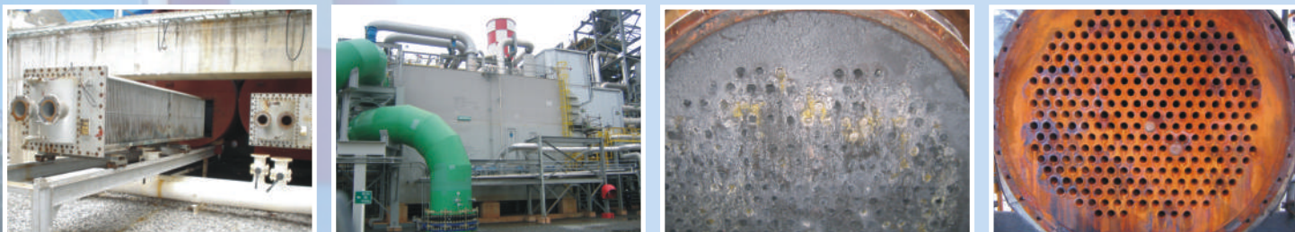
Limpeza de resfriadores