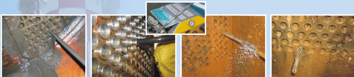
Limpeza mecânica rotativa através do sistema de brunimento